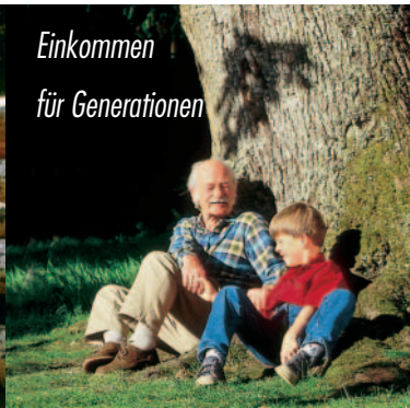
Einkommen für Generationen